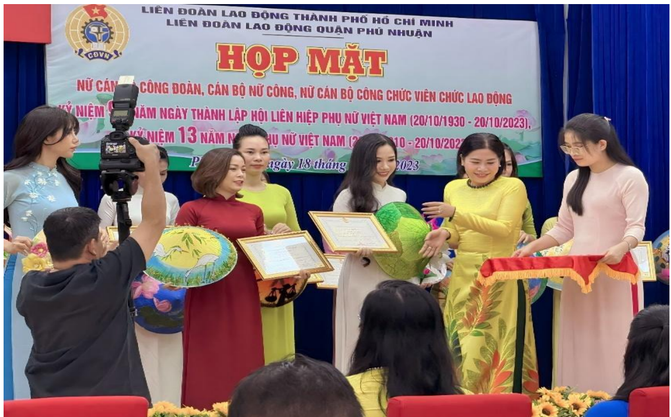
Hình lễ trao giải Hội thi Nghề che nét việt

Để có được chiếc nón lá mang ý nghĩa về con người và quê hương Việt Nam thì cần phải qua đôi bàn tay khéo léo của mỗi người thợ. Chính vì thế, trong cuộc thi trang trí nón lá lần này, Công đoàn trường Mầm Non Sơn Ca 11 muốn gửi gắm và chia sẻ đến Phụ nữ Việt Nam rằng “Phụ nữ Việt Nam không những trung hậu đảm đang mà còn đầy bản lĩnh để có thể vững bước trên đường đời và vươn cao vươn xa hơn nữa.