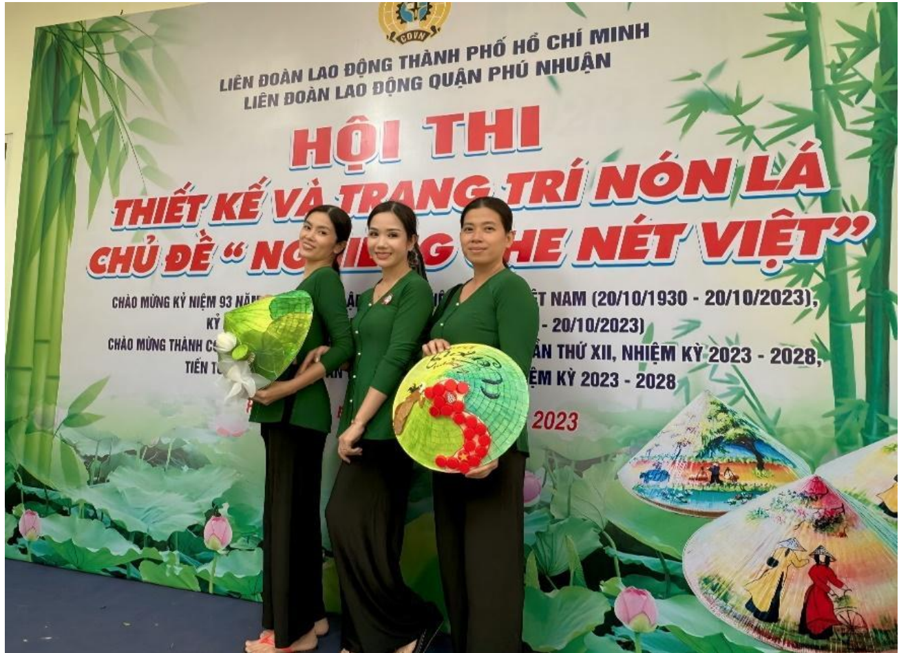
Hình sản phẩm đã hoàn chỉnh

Ngày 17/10/2023 Công đoàn cơ sở trường Mầm Non Sơn Ca 11 đã tham gia Hội thi thiết kế và trang trí nón lá với chủ đề “ Nghiêng che nét Việt ”, Chào mừng kỷ niệm 93 năm Ngày thành lập Hội liên hiệp Phụ nữ Việt Nam 20/10/1930 – 20/10/2023.