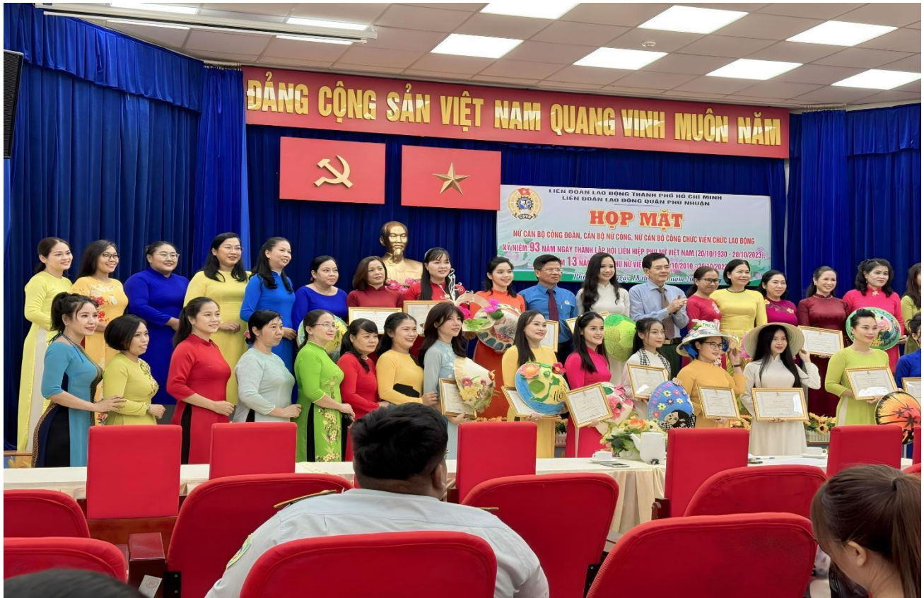
Hình ảnh lễ trao giải Hội thi

Nhân ngày Phụ nữ Việt Nam xin chúc Cán bộ, Giáo viên, Nhân viên luôn hạnh phúc và nhiều sức khỏe./.